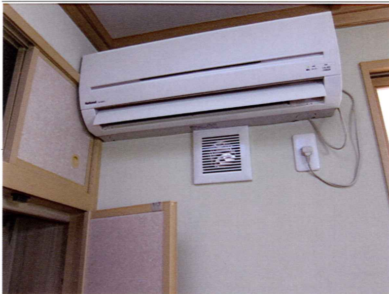
写真 ついでに二枚目の 吸気口と言う名の 穴がエアコンの下 につけられている 外の光が漏れてく るのでフィルター が汚れているとい とがわかる レジスターになっ ていないので閉じ ることはできない 相当寒いだろうな

各部屋に吸気口を 設けなければいけ ないと、 信じて疑わない建 築主事や国交省の 役人たちが 法律を曲解してこ んな家を増やして いる